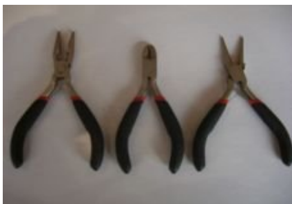
Les différentes sortes de pinces pour travailler dans de bonnes conditions.