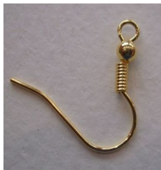
Supports de boucles d'oreilles.