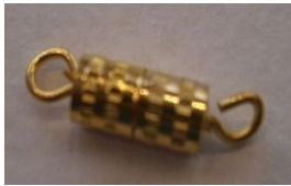
Fermoirs mousqueton et à vis.

Très pratique pour réaliser ses propres bijoux à tout petit prix.